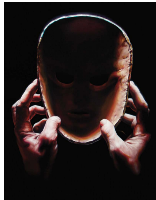
SKUSPILLERKUNSTNEREN, 40 x 30 CM, OLJE PÅ MARMOR