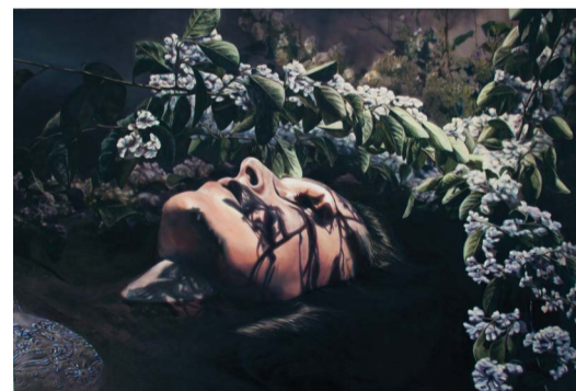
OPHELIA, 85 x 120 CM, OLJE PÅ LERRET