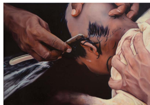
RITE, 40 x 55 CM, OLJE PÅ LERRET