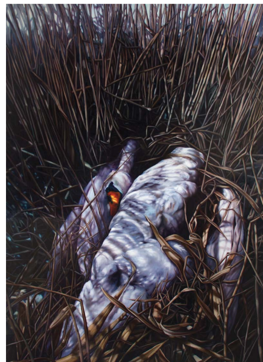
SWAN SONG, 200 x 140 CM, OLJE PÅ LERRET