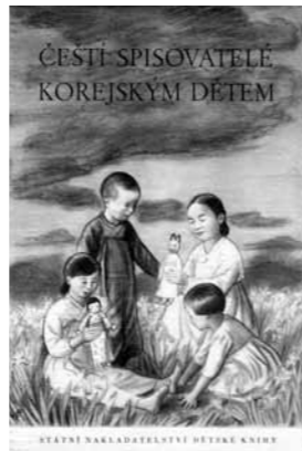
체코어로 된 선전 책자의 앞표지

체코슬로바키아 외교관들이 보고에서 보여준 시각은 소련권의 공산당 공식 선전내용과 매우 유사하다. 체코슬로바키아 매체는 북한에 대한 “제국주의자들의 공격”에 대해 매일 보도했고, 시각적 기록과 직접 입수한 보고가 널리 사용되고 읽혔다. 전시 상황에 대한 동시대의 직접적인 기술로는 6·25 전쟁 발발 불과 몇 달 후에 출간된 언론인 이리 호로넵의 전쟁에 폐허가 된 한국 기행기와 파벨 보야르(Pavel Bojar, 1919~1999)와 보후밀 아이슬트(Bohumil Eiselt, b. 1913)가 공저한 책을 꼽을 수 있다. 두 책 모두 많이 읽혀 체코슬로바키아 독자에게 상당한 영향을 끼쳤다. 잡지들도 종류를 불문하고 북한을 지지하는 선전문으로 가득했으며, 공산당원 편집자와 검열관이 주의 깊게 조작한 만화, 사진, “실제”의 이야기도 체코슬로바키아 매체에 소개되었다.