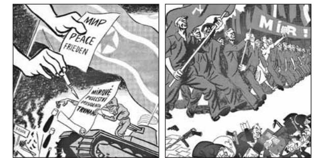
Political caricature by Antonín Pelc

(1927~2009) travelled across North Korea putting together an original Czechoslovak colour documentary film, Rozdělená země (The Divided Country), as well as a short documentary Československá nemocnice v Čondžinu (Czechoslovak Hospital in Cheongjin). Both were released in 1955. Two other documentaries followed, one about the life of North Korean children and orphans in Czechoslovakia (there were about one thousand at the time), and the other covered the Korean People's Army's artistic company tour of Czechoslovakia in 1953. North Korean films, with no real regard to their true artistic qualities, were awarded prizes at the Karlovy Vary International Film Festival. Some were viewed by a wider audience, being distributed in Czechoslovak cinemas.