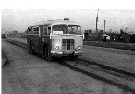
여러 대의 체코슬로바키아산 스코다 버스가 들어왔다.

6·25 전쟁 직후 체코슬로바키아 정부뿐만 아니라 더 막강한 권력기관인 체코슬로바키아 공산당 중앙위원회는 정부간에 전달된 물품을 체코슬로바키아가 북한에게 제공하는 선물로 승인했다. 이것은 1954년 7월 17일 체코슬로바키아 외교부장관 바츨라브 다비드(Václav David)가 북한 대표단을 만나는 자리에서 북한측에 전달되었다.