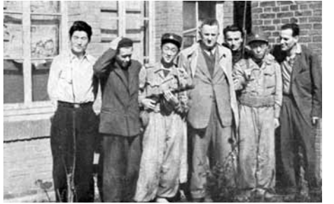
평양주재 체코슬로바키아 공사관, 1950년 9월

그 후 별다른 공통점이 없던 두 국가는 1년 가까이 아무런 교류가 없었다. 첫 쌍방교역에 대한 합의는 이미 1947년에 이루어진 것으로 알려져 있다. 1950년에는 체코슬로바키아가 3천5백만 체코슬로바키아 크라운 상당의 물품을 북한에 수출했다는 기록이 있지만, 그다지 큰 교역량은 아니었다. 외교관계 수립 후 양국의 상호 이해 증진을 위한 정기적인 대화는 모스크바에서 이루어졌다. 북한은 독립 직후 모스크바에 대사관을 설치했다. 체코슬로바키아와 북한 대표단은 여러 국제회의에서 만났으나, 양국의 유대관계는 내용적으로는 부실하였다.