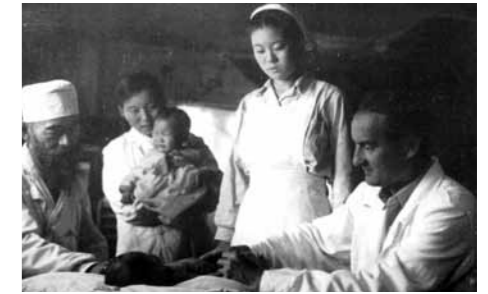
Work of Czech and Slovak medical doctors in Cheongjin

between Pyongyang and Sukcheon. Similar army hospitals were run by East German, Polish, Hungarian, Romanian and Bulgarian doctors at other locations in North Korea.