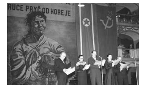
Pro-North Korean meeting in Czech National Theatre

Czech artists followed suit. In March 1951 a special invitational group exhibition, Čína – Korea (China – Korea), was opened in Prague. Its theme was the heroics of the Korean Nation. Artistic journals and magazines were filled with hundreds, if not thousands, of satirical drawings and illustrations. Many were reprinted, usually from the Soviet press, but more often elaborate ones were made by respected Czech and Slovak artists. The most remarkable being those of the leading figure of Czech political caricature, Antonín Pelc (1895~1967). 11