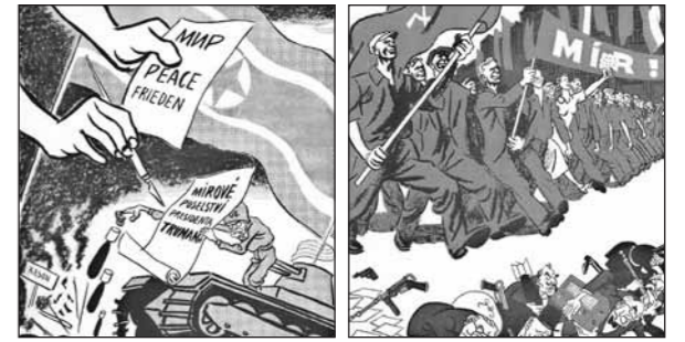
안토닌 펠츠의 정치적 캐리커처

한 영화였다. 초기 북한 관련 영화들은 예술성과는 무관하게 카를로비 바리(Karlovy Vary)국제영화제에서 수상했고, 일부는 체코슬로바키아 국내 영화관에서 일반 대중을 대상으로 상영되기도 했다.