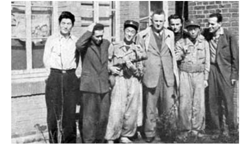
Czechoslovak Legation in Pyongyang, September, 1950

Czechoslovak and North Korean delegates often met at various international conferences, but still the ties lack substance.