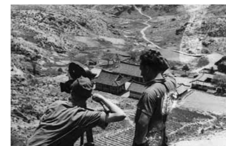
Ployhar is filming Czechoslovak art poster to early North Korean film

Not less than 25 books and booklets supporting the North Korean cause were published in Czechoslovakia during the years of the Korean War. The majority were nothing more than propaganda pieces, written both by Czechs as well as texts translated from Russian, Polish and Chinese. Czech readers could read travelogues by contemporary Russian journalists and even a somewhat dated travelogue of Korea written by a late 19th Century Russian ethnographer. 10 Added to these were literary works of North Korean writers such as Cho Ki-cheon (1913~1951), as well as translations of pro-North Korean books written by French, British and Russian writers. As the Communist Authorities wished that nobody in Czechoslovakia should remain indifferent to the Korean cause, pressure was put on leading Czech writers to support the North Korea. A poetry selection Čeští spisovatelé korejským dětem (Czech Writers to Korean Children, 1952) was the most visible of such literary propaganda endeavours. It included works of the then top Czech poet, such as Vítězslav Nezval (1900~1958). There was a real flood of such literary works published in anthologies and a wide range of periodicals. Such was the political atmosphere in Czechoslovakia at the time, that virtually every active Czech and Slovak writer wrote at least one pro-North Korean literary work, including future leading human rights activists and critics of communism such as Milan Kundera (b. 1929) or Pavel Kohout (b. 1928).