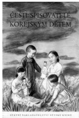
체코어로 된 선전 책자의 앞표지

체코슬로바키아에서는 북한의 명분을 지지하는 책 25권 이상이 6·25 전쟁 기간 동안에 출판되었다. 당시 출간된 책은 매우 다양했다. 대부분은 선전용에 불과했지만 (저자가 체코인