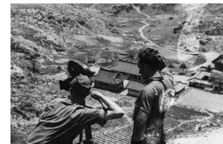
Ployhar is filming Czechoslovak art poster to early North Korean film

Not less than 25 books and booklets supporting the North Korean cause were published in Czechoslovakia during the years of the Korean War. The majority were nothing more than propaganda pieces, written both by Czechs as well as texts translated from Russian, Polish and Chinese. Czech readers could read travelogues by contemporary Russian journalists and even a somewhat dated travelogue of Korea written by a late 19th Century Russian ethnographer. 10 Added to these were literary works of North Korean writers such as Cho Ki-cheon (1913~1951), as well as translations of pro-North Korean books written by French, British and Russian writers. As the Communist Authorities wished that nobody in Czechoslovakia should remain indifferent to the Korean cause, pressure was put on leading Czech writers to support the North Korea. A poetry selection Čeští spisovatelé korejským dětem (Czech Writers to Korean Children, 1952) was the most visible of such literary propaganda endeavours. It included works of the then top Czech poet, such as Vítězslav Nezval (1900~1958). There was a real flood of such literary works published in anthologies and a wide range of periodicals. Such was the political atmosphere in Czechoslovakia at the time, that virtually every active Czech and Slovak writer wrote at least one pro-North Korean literary work, including future leading human rights activists and critics of communism such as Milan Kundera (b. 1929) or Pavel Kohout (b. 1928).