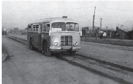
Numerous Czechoslovak-made Skoda buses were delivered

In April 1953 Czechoslovakia accepted another 700 orphans who arrived shortly after the truce was signed. Both university and secondary school students, as well as the War orphans who stayed in Czechoslovakia where supported by their hosts for several years. Expenditure to cover their education and the other needs is conservatively estimated to at least 100 million Czechoslovak Crowns.