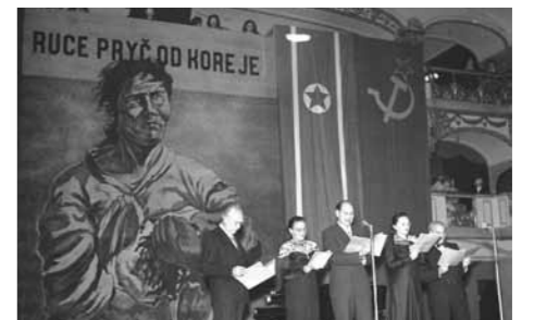
체코슬로바키아 국립극장에서 열린 북한 지지 집회

체코슬로바키아 미술가들 역시 한국의 “영웅적 행보”라는 모토 하에 특별 초대 단체인 「중국-한국(Čína - Korea)」을 1951년 3월에 개최했다. 신문과 잡지는 (주로 소련 언론에서 제공받아) 재판되거나 체코슬로바키아에서 원작에 설명을 붙인 풍자적인 그림을 수 백에서 수 천 편씩 게재했는데 이 중 상당 수는 높이 평가 받는 체코와 슬로바키아 예술가들의 작품이다. 그 중 가장 인상 깊은 작품들은 체코슬로바키아 정치적 캐리커처의 거물인 안토닌 펠츠(Antonín Pelc, 1895~1967)의 그림이다. 11