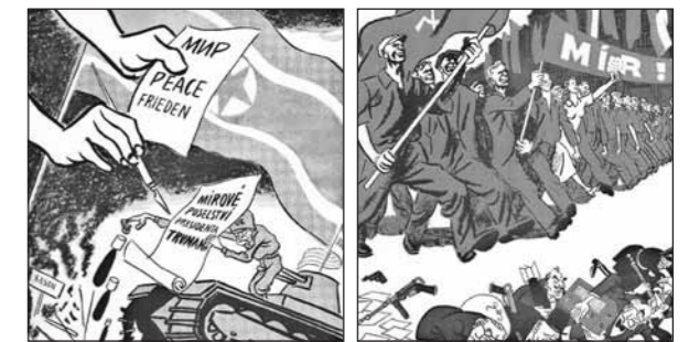
Political caricature by Antonín Pelc

(1927~2009) travelled across North Korea putting together an original Czechoslovak colour documentary film, Rozdělená země (The Divided Country), as well as a short documentary Československá nemocnice v Čondžinu (Czechoslovak Hospital in Cheongjin). Both were released in 1955. Two other documentaries followed, one about the life of North Korean children and orphans in Czechoslovakia (there were about one thousand at the time), and the other covered the Korean People's Army's artistic company tour of Czechoslovakia in 1953. North Korean films, with no real regard to their true artistic qualities, were awarded prizes at the Karlovy Vary International Film Festival. Some were viewed by a wider audience, being distributed in Czechoslovak cinemas.