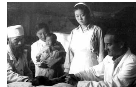
Work of Czech and Slovak medical doctors in Cheongjin

between Pyongyang and Sukcheon. Similar army hospitals were run by East German, Polish, Hungarian, Romanian and Bulgarian doctors at other locations in North Korea.