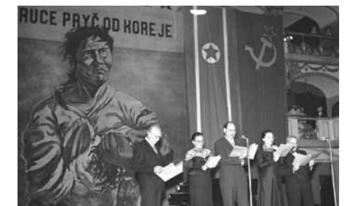
Pro-North Korean meeting in Czech National Theatre

Czech artists followed suit. In March 1951 a special invitational group exhibition, Čína – Korea (China – Korea), was opened in Prague. Its theme was the heroics of the Korean Nation. Artistic journals and magazines were filled with hundreds, if not thousands, of satirical drawings and illustrations. Many were reprinted, usually from the Soviet press, but more often elaborate ones were made by respected Czech and Slovak artists. The most remarkable being those of the leading figure of Czech political caricature, Antonín Pelc (1895~1967). 11