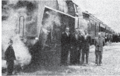
Czechoslovak officials presenting locomotive to North Korea

Tens of millions of Czechoslovak Crowns were used to assist North Korean War orphans. While China accepted some 20,000 Korean orphans, numbers permitted to leave for Eastern Europe were far smaller. Most host nations speak officially of about 200 sent to each country, although in reality the final numbers were higher. In May 1952 the first group consisting of 200 North Korean orphans arrived in Czechoslovakia.