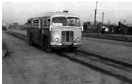
여러 대의 체코슬로바키아산 스코다 버스가 들어왔다.

6·25 전쟁 직후 체코슬로바키아 정부뿐만 아니라 더 막강한 권력기관인 체코슬로바키아 공산당 중앙위원회는 정부간에 전달된 물품을 체코슬로바키아가 북한에게 제공하는 선물로 승인했다. 이것은 1954년 7월 17일 체코슬로바키아 외교부장관 바츨라브 다비드(Václav David)가 북한 대표단을 만나는 자리에서 북한측에 전달되었다.