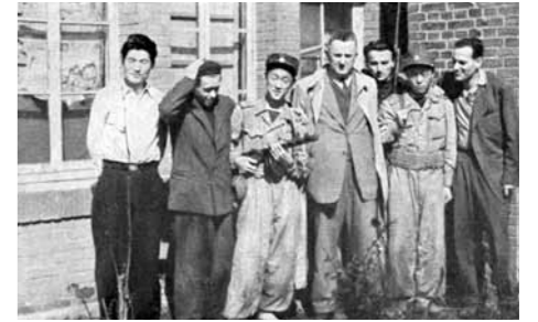
평양주재 체코슬로바키아 공사관, 1950년 9월

그 후 별다른 공통점이 없던 두 국가는 1년 가까이 아무런 교류가 없었다. 첫 쌍방교역에 대한 합의는 이미 1947년에 이루어진 것으로 알려져 있다. 1950년에는 체코슬로바키아가 3천5백만 체코슬로바키아 크라운 상당의 물품을 북한에 수출했다는 기록이 있지만, 그다지 큰 교역량은 아니었다. 외교관계 수립 후 양국의 상호 이해 증진을 위한 정기적인 대화는 모스크바에서 이루어졌다. 북한은 독립 직후 모스크바에 대사관을 설치했다. 체코슬로바키아와 북한 대표단은 여러 국제회의에서 만났으나, 양국의 유대관계는 내용적으로는 부실하였다.