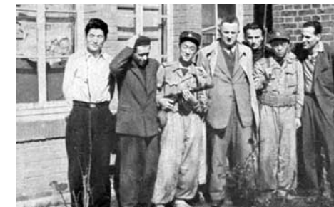
Czechoslovak Legation in Pyongyang, September, 1950

Czechoslovak and North Korean delegates often met at various international conferences, but still the ties lack substance.