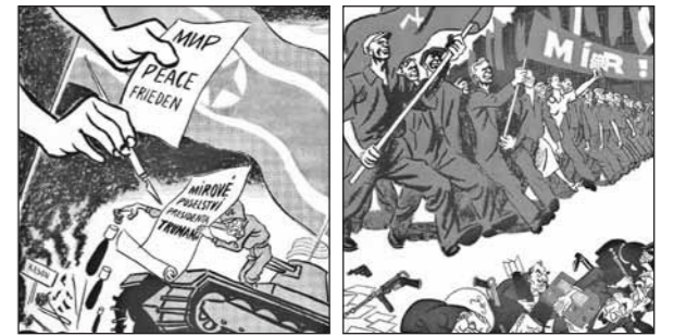
안토닌 펠츠의 정치적 캐리커처

한 영화였다. 초기 북한 관련 영화들은 예술성과는 무관하게 카를로비 바리(Karlovy Vary)국제영화제에서 수상했고, 일부는 체코슬로바키아 국내 영화관에서 일반 대중을 대상으로 상영되기도 했다.