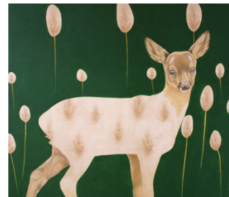
SUOJAVÄRI , 2014.

ITSENSÄ PIIRTÄMINEN eläinhahmoin ei ole exhibitionismia, vaan pikemminkin sen vastakohta: mahdollisuus in-