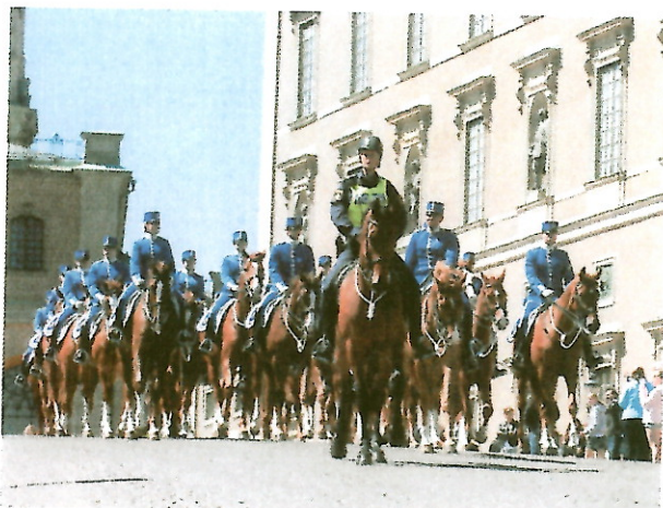
Hästhämtarstyrkan klädda i Livgardets blå uniform rider hem hästarna från slottet.

Hästarna är tränade med kandar som har två tyglar. Alla rider med enhandsfattning. Musikkåren har sitt instrument i andra handen och soldater samt befäl har sin sabel i den tygelfria handen.