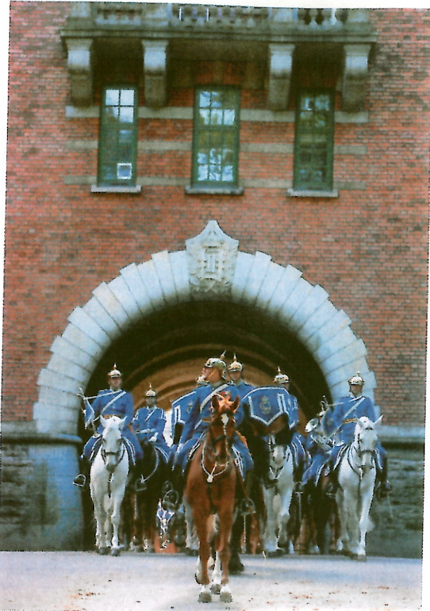
Avmarschen från Kavallerikasern mot Stockholms slott.

Varje gång en beriden högvakt närmar sig slottet hörs en fanfar spelad. Det sker alltid i höjd med Storkyrkan. Fanfaren är igenkänningsignal för Livgardets dragoner och är dessutom inledning till förbandets marsch "Dragonerna komma".