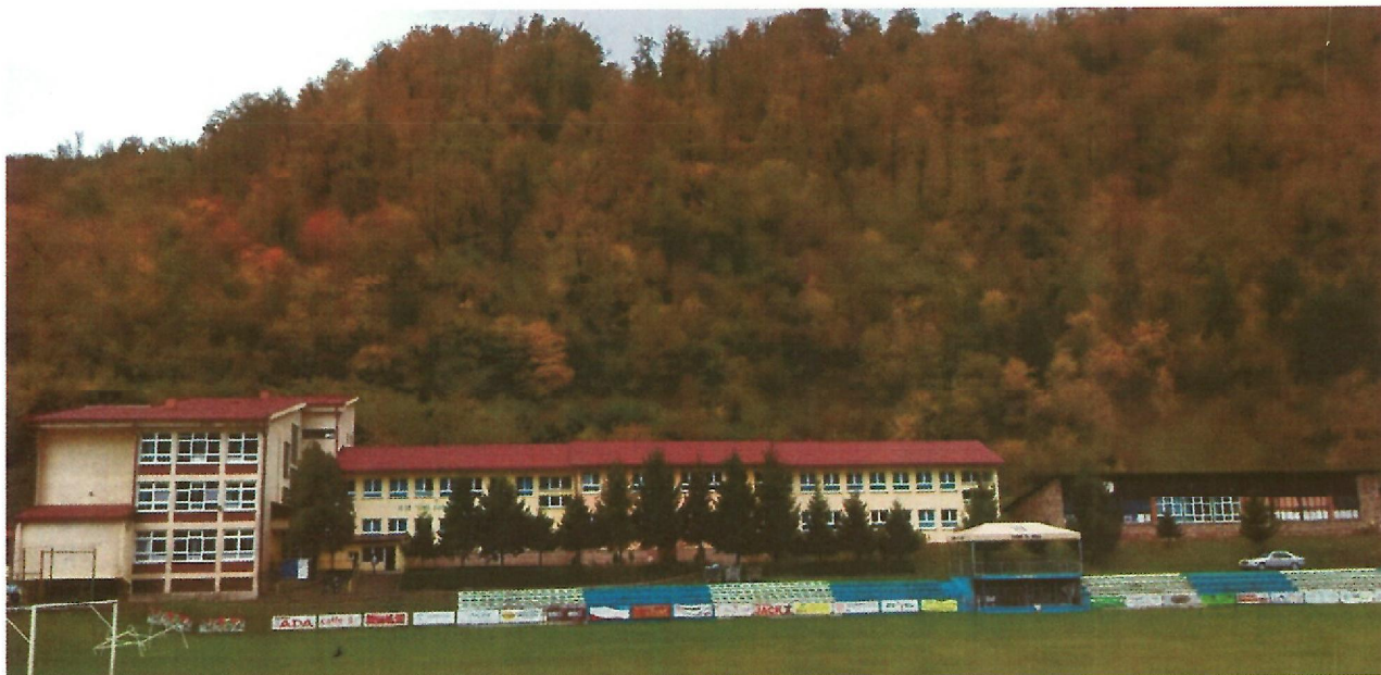
11. Základní škola připojená k CZT, vpravo další školní budova, která se bude rekonstruovat a poté se připojí k CZT