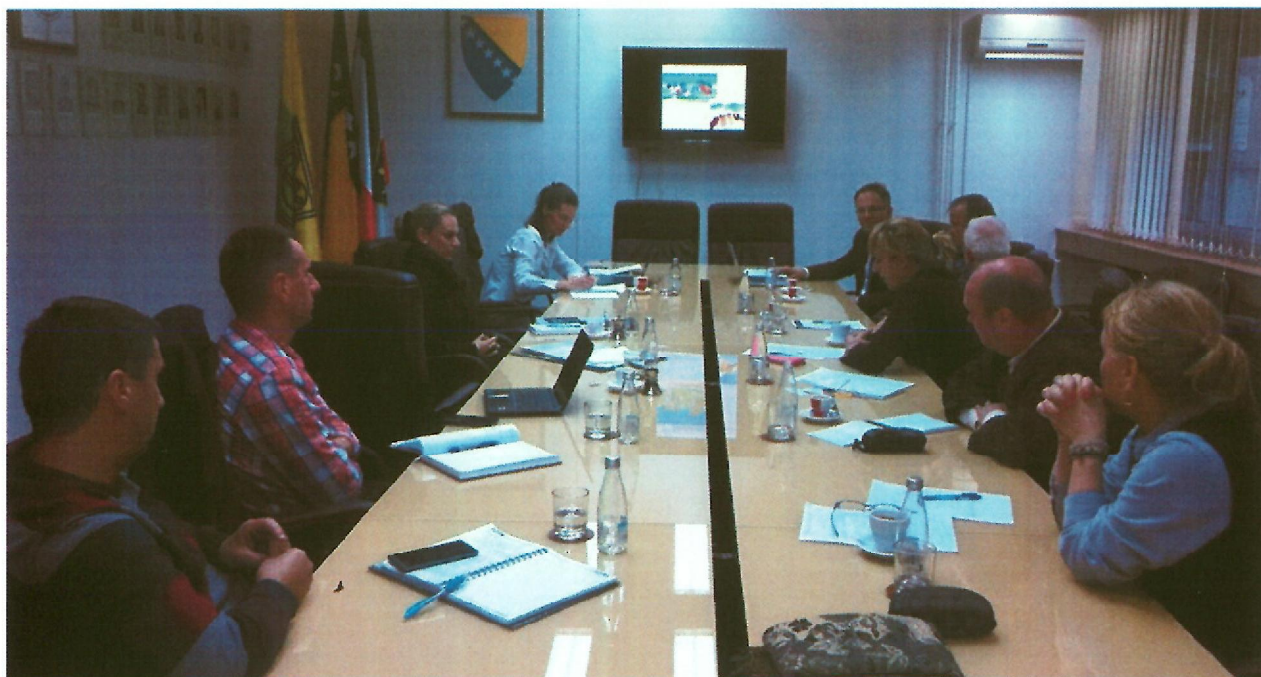
15. Debriefing v Zenici 24.10.2017