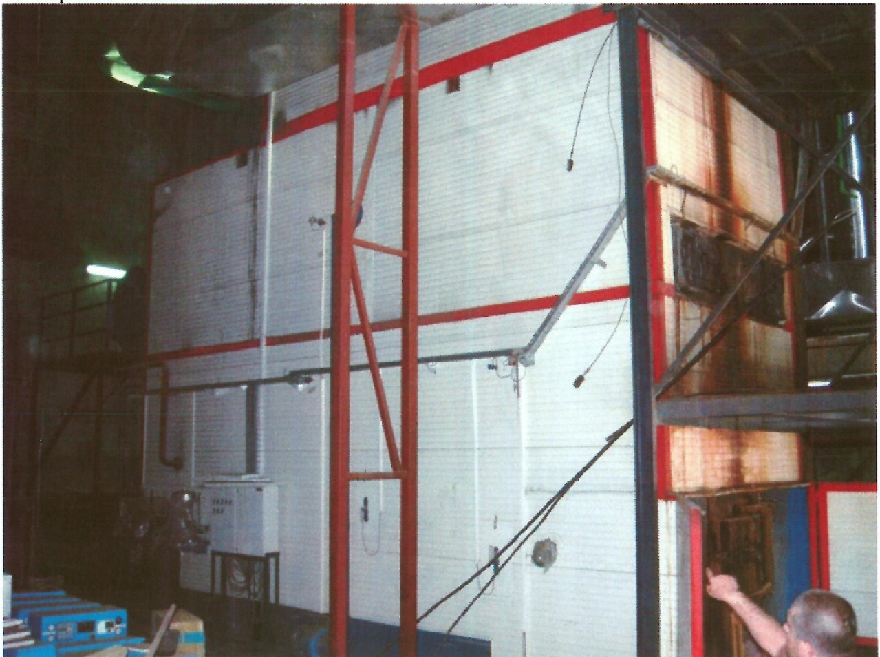
14. Kotel teplárny v Gračanicí 7.7.2017