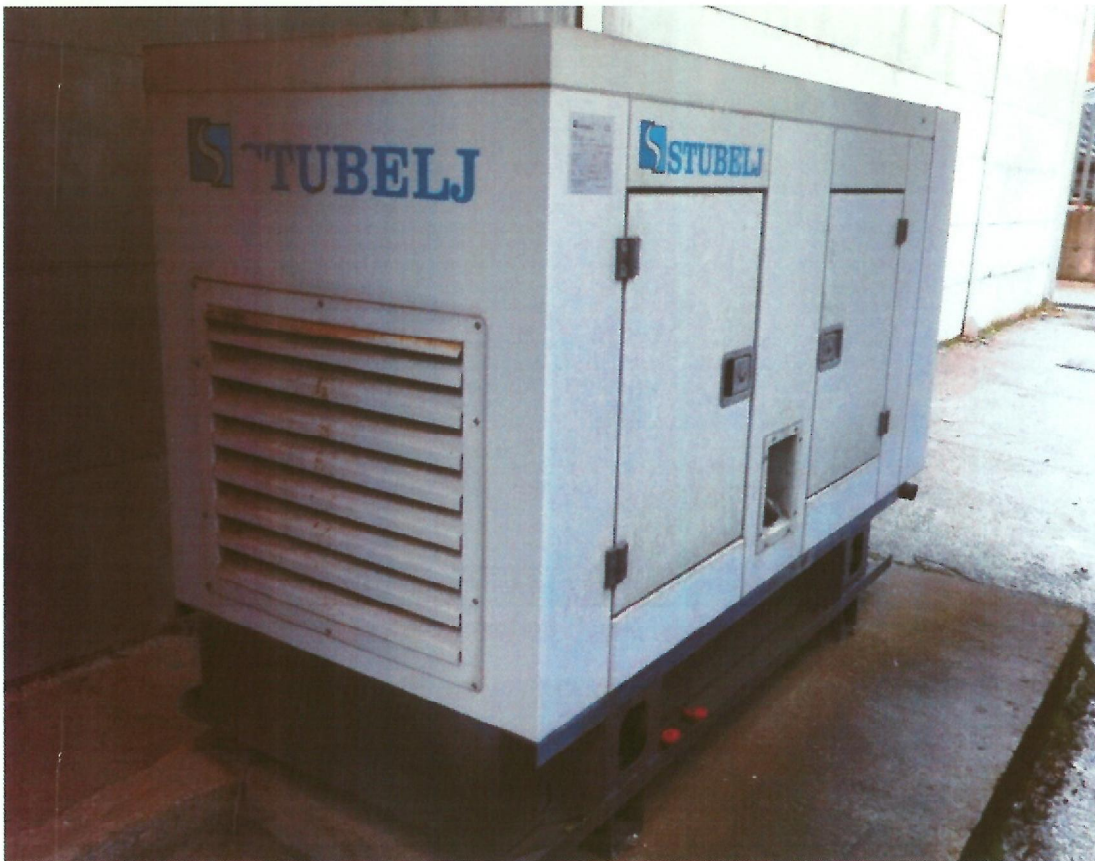
9. Záložní zdroj