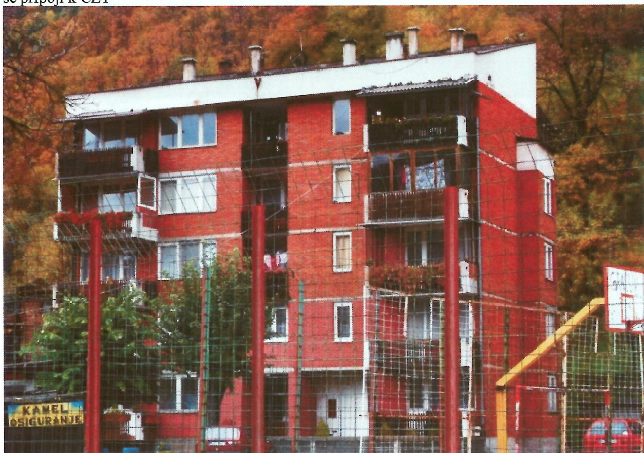
12. Bytový dům, jehož připojení k CZT bylo plánováno původně plánováno. CZT je do domu přivedeno, ale o přípojky měly zájem jen 3 z 10 domácností.