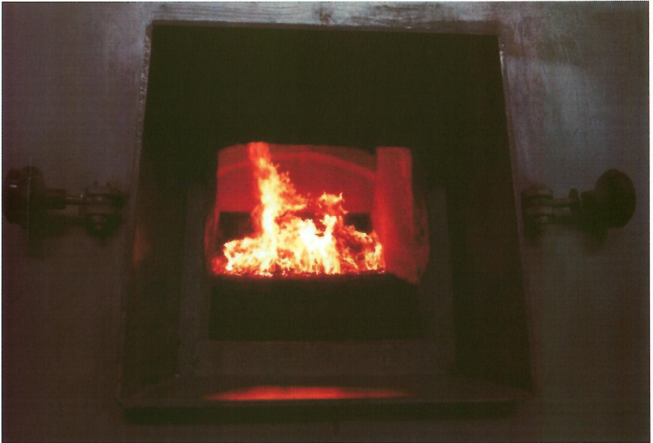
5. Pohled do kotle 23.10. 2017