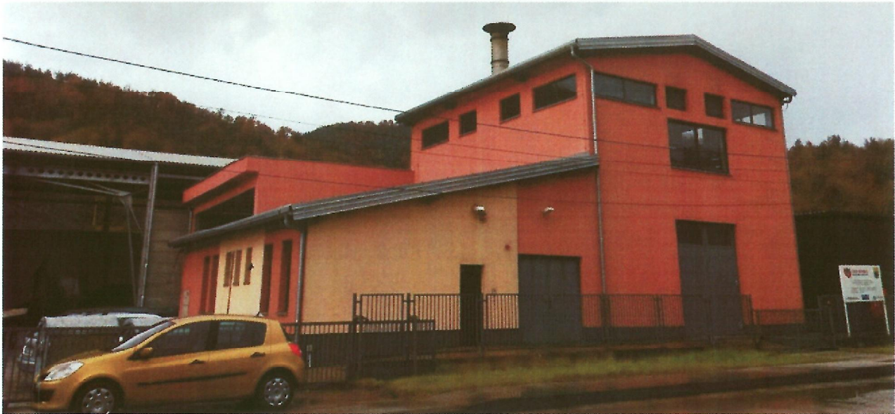
1. Pohled na teplárnu Nemila 23.10.2017