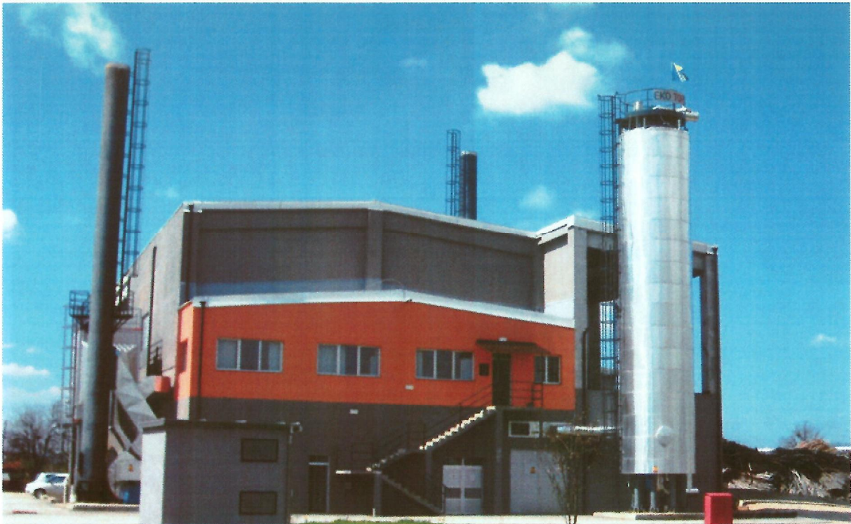
13. Teplárna v Gračanicí 25.10.2017