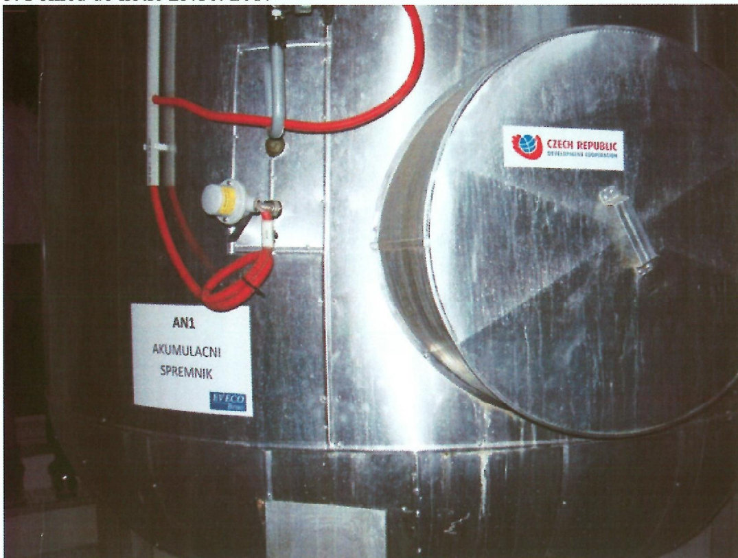
6. Akumulační zásobník