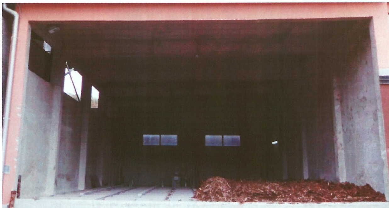
3. Podávací zařízení s biomasou 23.10.2017