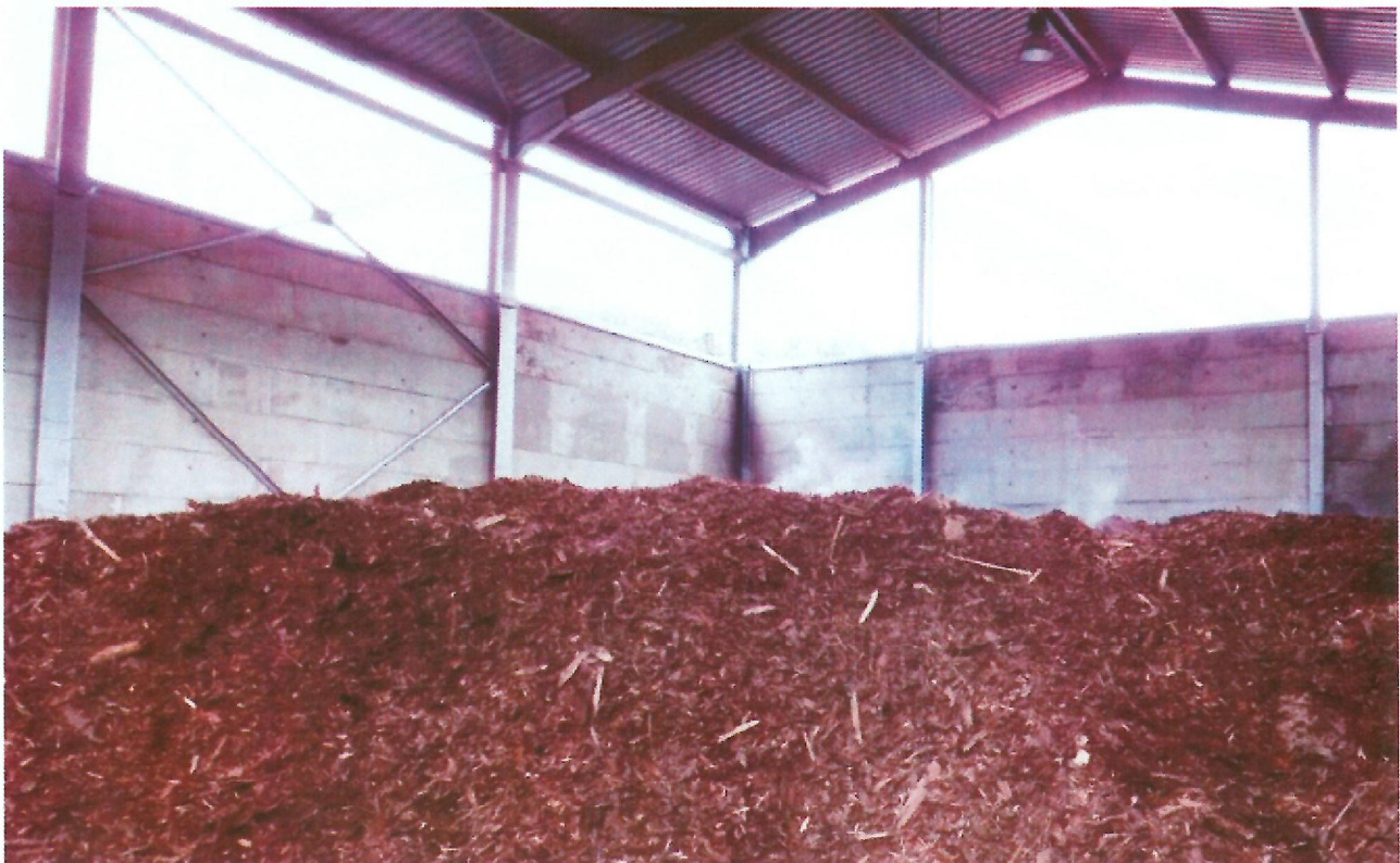
2. Sklad biomasy 23.10.2017