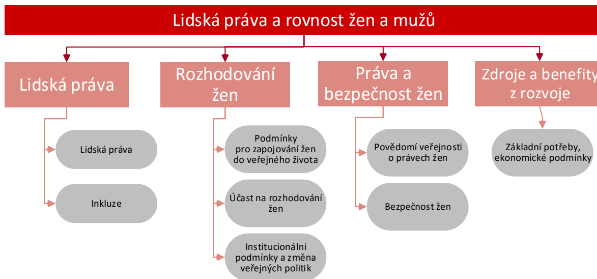
Obrázek 3 Dimenze konceptu Lidská práva a rovnost mužů a žen

Pekingská deklarace a platforma pro akci, která byla přijata na Čtvrté světové konferenci o ženách v roce 1995, určila následujících 12 kritických oblastí, v nichž by mělo dojít k posílení postavení a rovnosti žen: ženy a chudoba, vzdělání a školení žen, ženy a zdraví, násilí na ženách, ženy a ozbrojený konflikt, ženy a ekonomika, ženy u moci a v pozici rozhodování, institucionální mechanismy pro podporu žen, lidská práva žen, ženy a media, ženy a životní prostředí, dívky. Rozvojové intervence v tomto ohledu se do značné míry soustředily na tři hlavní oblasti: vytváření více příležitostí pro ženy vydělat si na živobytí a získat ekonomickou nezávislost; podpora politické reprezentace žen a umožnění ženám větší účast při rozhodování o svém vlastním životě; mít kontrolu nad vlastními těly a sexualitou. 19