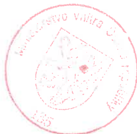
Ing. Denisa Zyková vedoucí oddělení

Proti tomuto usnesení lze podat odvolání ke Komisi pro rozhodování ve věcech pobytu cizinců, a to dle ustanovení § 81 odst. 1 zákona č. 500/2004 Sb., správní řád, ve spojení s § 170b odst. 1 zákona č. 326/1999 Sb., o pobytu cizinců na území České republiky a o změně některých zákonů, v platném znění. Podle ustanovení § 86 odst. 1 správního řádu se odvolání podává u odboru azylové a migrační politiky Ministerstva vnitra České republiky, a to dle ustanovení § 83 odst. 1 správního řádu ve lhůtě do 15 dnů ode dne oznámení tohoto usnesení. Podle ustanovení § 76 odst. 5 správního řádu nemá odvolání proti tomuto usnesení odkladný účinek.