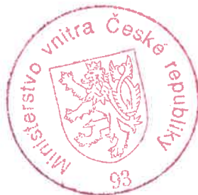
Ing. Viera Kubienková ministrský rada

Proti tomuto usnesení lze podat odvolání ke Komisi pro rozhodování ve věcech pobytu cizinců, a to dle ustanovení § 81 odst. 1 zákona č. 500/2004 Sb., správní řád, ve spojení s § 170b odst. 1 zákona č. 326/1999 Sb., o pobytu cizinců na území České republiky a o změně některých zákonů, v platném znění. Podle ustanovení § 86 odst. 1 správního řádu se odvolání podává u odboru azylové a migrační politiky Ministerstva vnitra České republiky, a to dle ustanovení § 83 odst. 1 správního řádu ve lhůtě do 15 dnů ode dne oznámení tohoto usnesení. Podle ustanovení § 76 odst. 5 správního řádu nemá odvolání proti tomuto usnesení odkladný účinek.