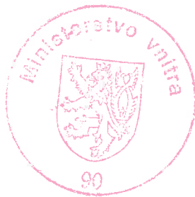
Ing. Josef Ambrož vedoucí oddělení pro pracovní migraci

Proti tomuto usnesení lze podat odvolání ke Komisi pro rozhodování ve věcech pobytu cizinců, a to dle ustanovení § 81 odst. 1 správního řádu ve spojení s ustanovením § 170b odst. 1 zákona č. 326/1999 Sb. Podle ustanovení § 86 odst. 1 správního řádu se odvolání podává u odboru azylové a migrační politiky Ministerstva vnitra České republiky, a to dle ustanovení § 83 odst. 1 správního řádu ve lhůtě do 15 dnů ode dne oznámení tohoto rozhodnutí. Podle ustanovení § 76 odst. 5 správního řádu nemá odvolání proti tomuto usnesení odkladný účinek .