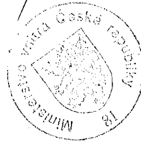
Mgr. Martin Bartoň vedoucí oddělení imigrace

Proti tomuto rozhodnutí lze podat odvolání ke Komisi pro rozhodování ve věcech pobytu cizinců, a to dle ustanovení § 81 odst. 1 zákona č. 500/2004 Sb., správní řád, ve spojení s § 170b odst. 1 zák. č. 326/1999 Sb., o pobytu cizinců na území České republiky a o změně některých zákonů, v platném znění. Podle ustanovení § 86 odst. 1 správního řádu se odvolání podává u odboru azylové a migrační politiky Ministerstva vnitra České republiky, a to dle ustanovení § 83 odst. 1 správního řádu ve lhůtě do 15 dnů ode dne oznámení tohoto rozhodnutí.