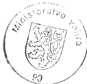
Mgr. Alan Stryja

Proti tomuto usnesení lze podat odvolání ke Komisi pro rozhodování ve věcech pobytu cizinců, a to dle ustanovení § 81 odst. 1 zákona č. 500/2004 Sb., správní řád, ve spojení s § 170b odst. 1 zákona č. 326/1999 Sb., o pobytu cizinců na území České republiky a o změně některých zákonů, v platném znění. Podle ustanovení § 86 odst. 1 správního řádu se odvolání podává u odboru azylové a migrační politiky Ministerstva vnitra České republiky, a to dle ustanovení § 83 odst. 1 správního řádu ve lhůtě do 15 dnů ode dne oznámení tohoto usnesení. Podle ustanovení § 76 odst. 5 správního řádu nemá odvolání proti tomuto usnesení odkladný účinek.