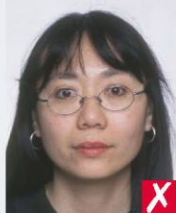
оправа, що закриває очі