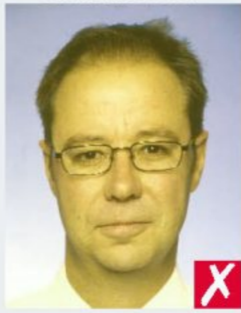
неприродний колір шкіри