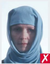
обличчя в тіні