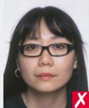
затовста оправа окулярів