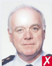
бліки на шкірі