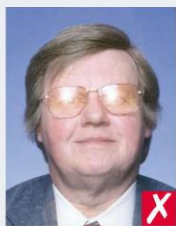
блік на окулярах