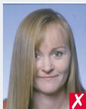
волосся закриває очі