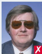
окуляри темного кольору