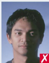
тінь на обличчі