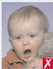
відкритий рот та іграшка, зблизько