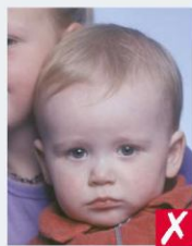
зображено іншу особу