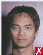
тінь за головою