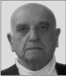
O LEG MALEVIČ