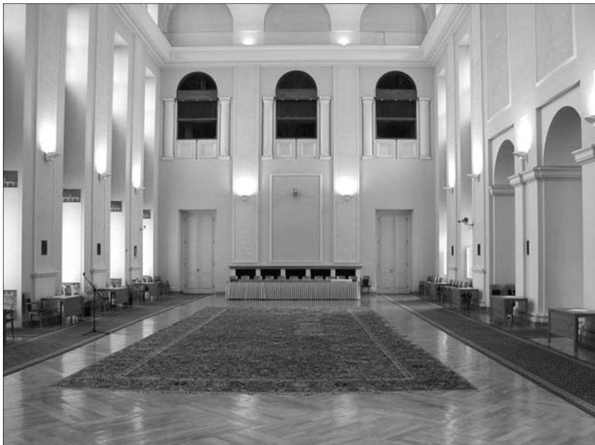
Velký sál Černínského paláce The Great Hall of the Czernin Palace