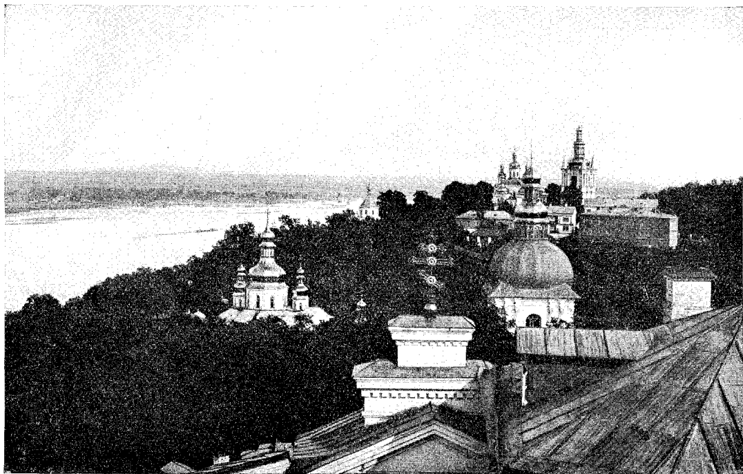
Kyjev. — Pečerský klášter.

shoda a porozumění naplňují tyto dva světy a že mezi československé dobrovolníky, revolucionáře a povstalce — a mezi ruské velitele, pouze a výhradně vojíny pravidelné armády, nadto ne vždy dobře chápající národně politické cíle svých podřízených, leckdy se vplíží nedůvěra, napětí i ostrý a bolestný konflikt? Tím spíše, že jak na jedné, tak na druhé straně objeví se někde jednotlivci morálně slabí, ba špatní, pro které se nehodí jméno československého vojína ani jeho velitele.