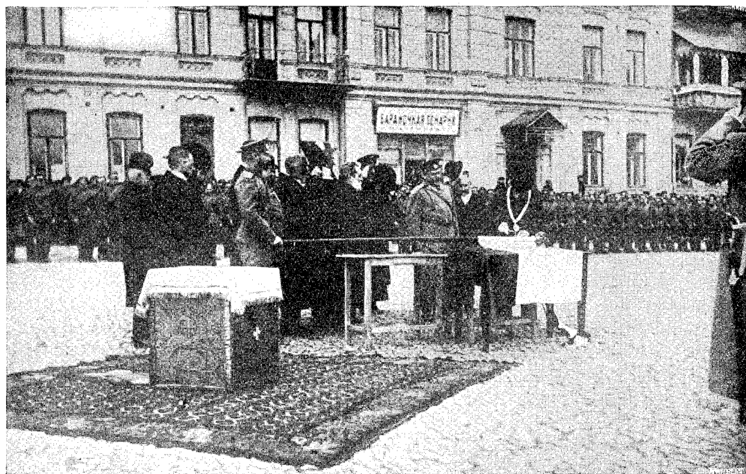
Zatloukání hřebů do žerdě.