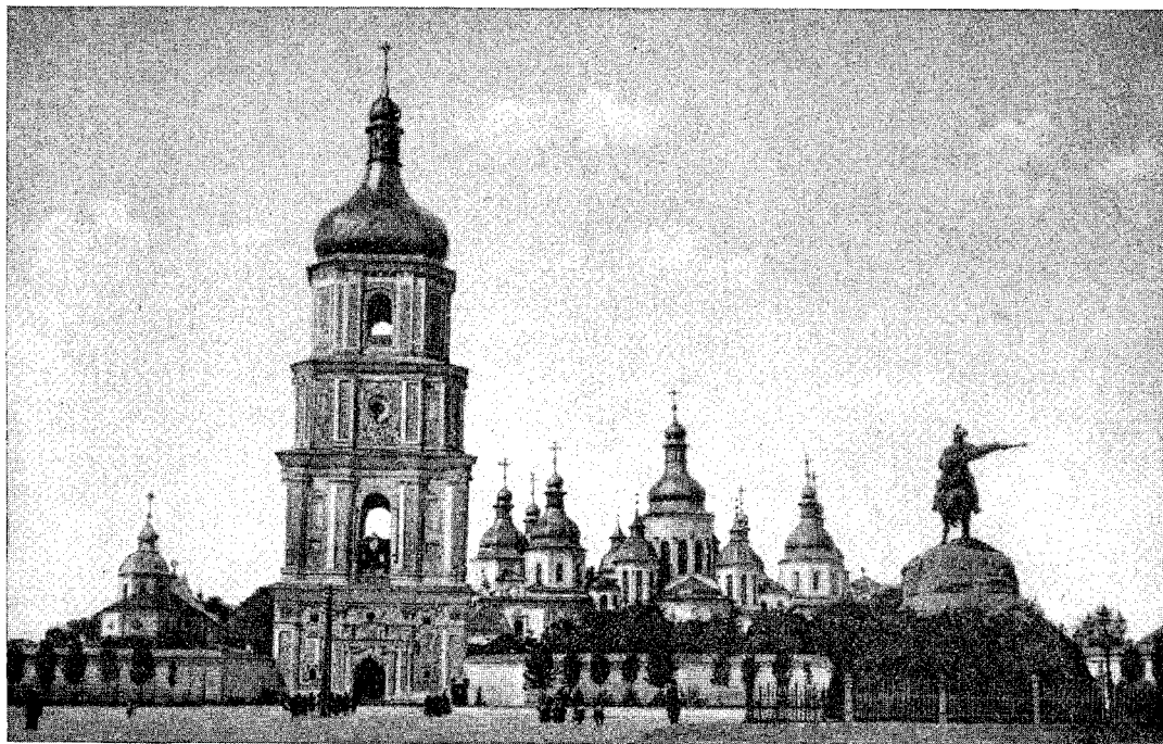
Kathedrála sv. Sofie v Kyjevě. Pomník Bohdana Chmelnického.