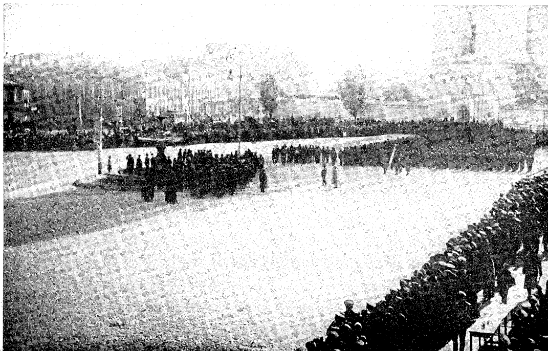
na Sofijském náměstí.