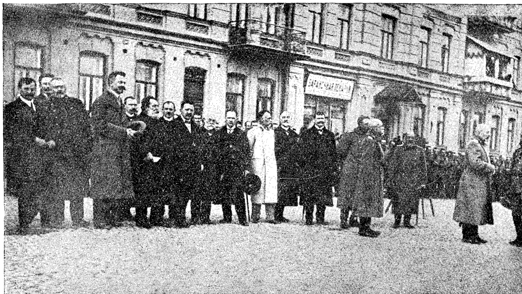
Představitelé československých kolonií v den přísahy.

doucnosti, jako přísaha celého národa, slib Družiny vlasti, stkví se koruna svatováclavská.