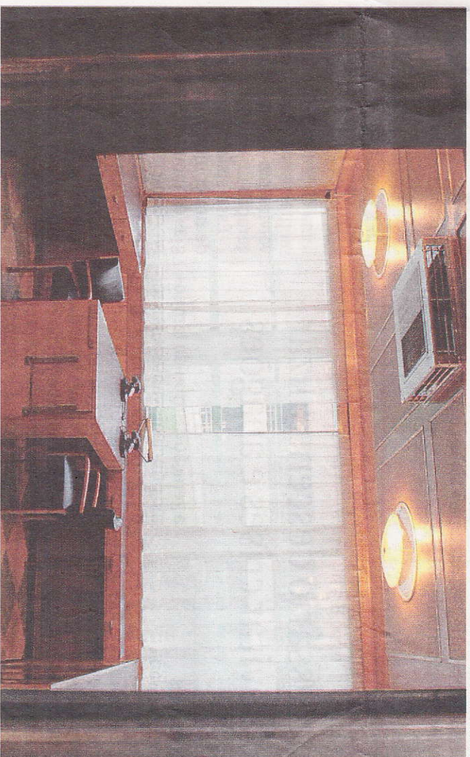
Operários consertam telhado de fábrica de sapatos na vila industrial erguida por Tomas B