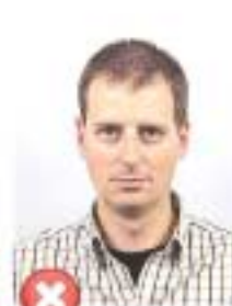
Příliš vzadu Too far away