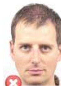
Příliš blízko Too close