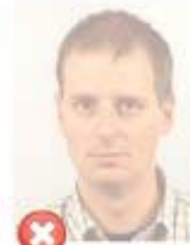
Vybledlý tisk Washed out colour