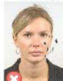
Stopy inkoustu / přehnutá Ink marked / creased