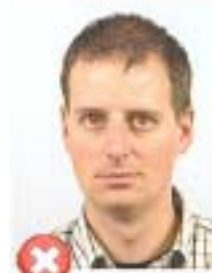
Červené oči Red eyes