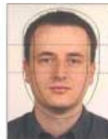
Umístění obličeje Positioning of face