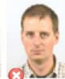
Nizké rozlišení Pixelated