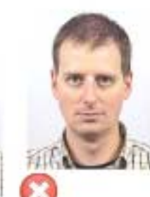
Příliš malá Too small