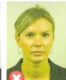
Nepřirozené barvy pokožky Unnatural skin tones