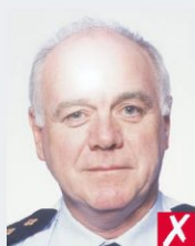
бліки на шкірі