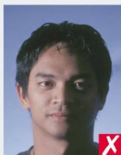
тінь на обличчі