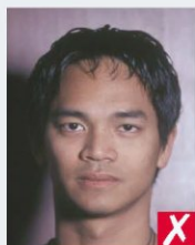
тінь за головою