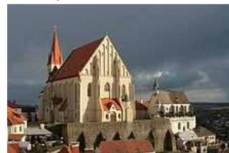
Mikulášské náměstí, vlevo kostel sv. Mikuláše, vpravo Svatováclavská kaple

Ve městě Znojmě se nachází mnoho památek, z nichž jsou některé zapsány i do seznamů kulturních památek ČR. Samotné město Znojmo je městskou památkovou rezervací, ve městě se nachází i Národní kulturní památka České republiky - rotunda svaté Kateřiny z 12. století, ta je památkově chráněna z důvodu zachovalých nástěnných maleb z roku 1134, jež zobrazují přemyslovskou rodovou pověst a podobizny vládnoucích přemyslovských knížat a králů a také podobizny moravských úředních knížat. Mimo tuto NKP ČR se ve městě nachází i 216 nemovitých kulturních památek ČR. Mezi nejznámější tyto památky patří znojemské kostely, Loucký klášter a