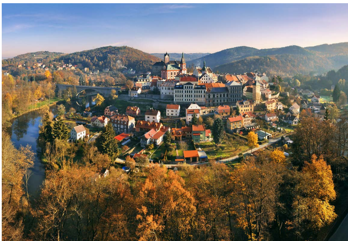
Loket nad Ohří