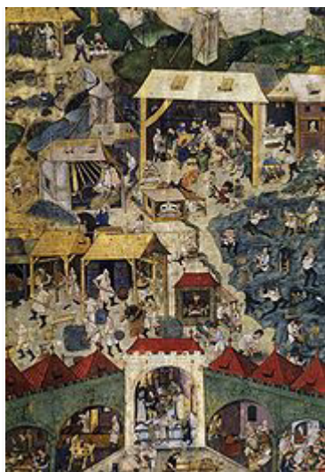
Těžba a úprava stříbrné rudy v Kutné Hoři. Knižní malba z 90. let 15. století

Protože městské kostely stále podléhaly sedleckému klášteřu, vzniklo roku 1384 hornické bratrstvo pro stavbu nového, tzv. „horního“ chrámu sv. Barbory na pozemcích vyšehradské kapituly a za městskou hradbou. I když výnos dolů v té době klesal, stavební činnost rostla a král Václav IV. dal rozšířit Vlašský dvůr, kde často býval a roku 1409 zde podepsal Dekret kutnohorský o novém rozdělení pravomocí na pražské univerzitě. Roku 1413 horníci přepadli Malín a pobili obyvatele, protože jim bránili v dolování, 1416 zavraždili královského vyslance a ve městě se rozhořely národnostní a náboženské spory.