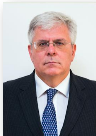
S. Exc. M Igor Slobodník l'Ambassadeur de la République slovaque en France