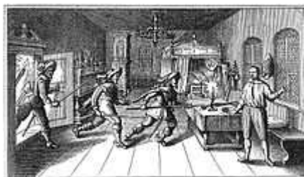
Zavraždění Albrechta z Valdštejna v Chebu

Po roce 1945 byla většina obyvatelstva německé národnosti vysídlena do Německa, což způsobilo značný pokles počtu obyvatel (předválečného stavu bylo dosaženo až v 90. letech 20. století). Po revoluci se zde usídlila velká komunita Vietnamců, kteří zde podnikají se svými tržišti. V Chebu je největší procento Vietnamců v celé ČR.