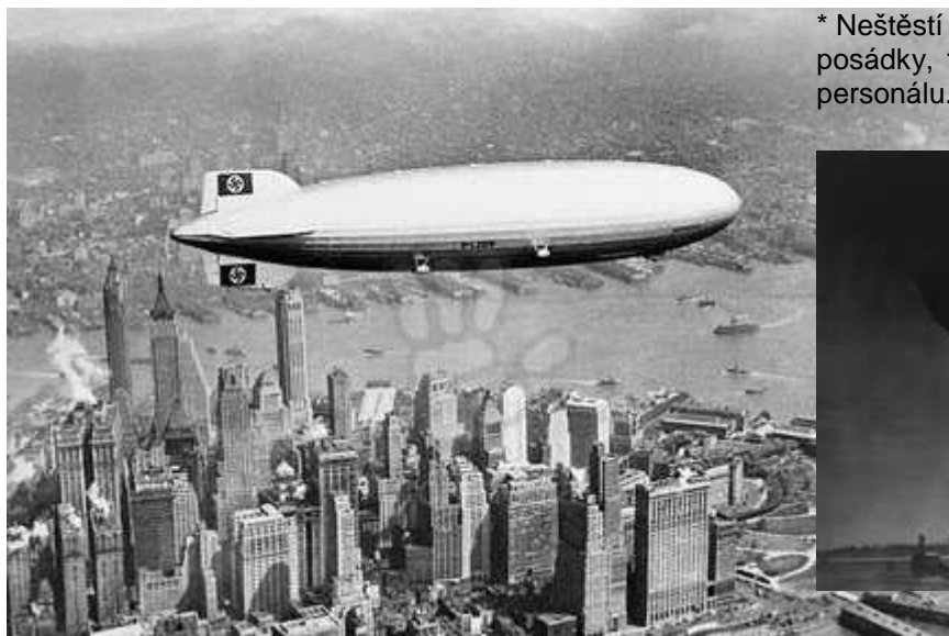
Hindenburg nad newyorským Manhattanem

Před 75 lety havaroval »nebeský Titanic«, vzducholod' Hindenburg!