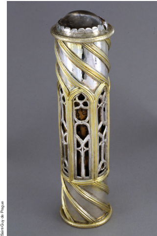
Reliquaire en argent et or, fragment de la robe paternelle (détail), œuvre prague, reproduction de la cathédrale Saint-Guy de Prague

En présence de Madame Adriana Krnáčová, Maire de Prague et de Madame Lydie Polfer, Bourgmestre de la Ville de Luxembourg