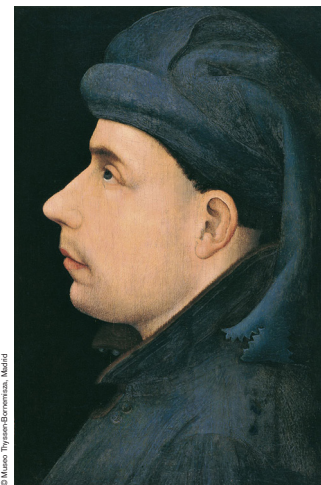
Portrait posthume de Wenceslas de Luxembourg, Duc de Brabant, ca. 1440-45 (détail), anonyme, huile sur toile

Kaiser Karl IV. hat wie kein anderer Herrscher zuvor seine zahlreichen Reisen dazu benutzt, Reliquien zu sammeln. Der Vortrag soll eine Kampagne genauer unter die Lupe nehmen, die den großen Luxemburger 1354/55 in die Städte an Rhein und Mosel geführt hat. Dabei soll eine Antwort auf die Frage gefunden werden, welche religiösen und politischen Motive hinter dieser Sammelleidenschaft steckten und was der Kaiser mit diesen Reliquien vorhatte.