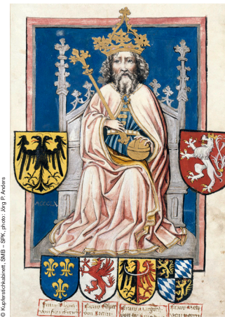
Miniature de Charles IV, détail des armoiries de l'Empire, détail, vers 1400-1425, garde sur parchemin

Si vous souhaitez assister à une des conférences, nous vous prions de vous inscrire par mail au: visites@2musees.vdl.lu ou bien par téléphone au: T+ 352 4796 4500.