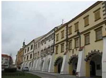
Domy s podloubím na Velkém náměstí